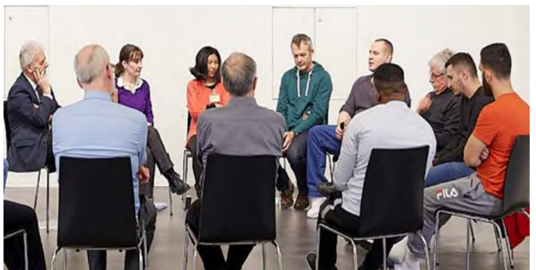
In der JVA Lenzburg werden seit 2017 restaurative Dialoge zwischen Opfer und Tätern durchgeführt

oder Konferenzen die in Beziehung stehenden Betroffenen treffen, kennen sich Opfer und Täter bei Restaurativen Gruppenspendialogen nicht und stehen nicht in direkter Verbindung zueinander. Es treffen sich daher Opfer und Täter gleicher oder ähnlicher Straftaten, um über die Auswirkungen von Verbrechen zu sprechen, und gemeinsam ihre Erlebnisse aufzuarbeiten. Wichtig ist,